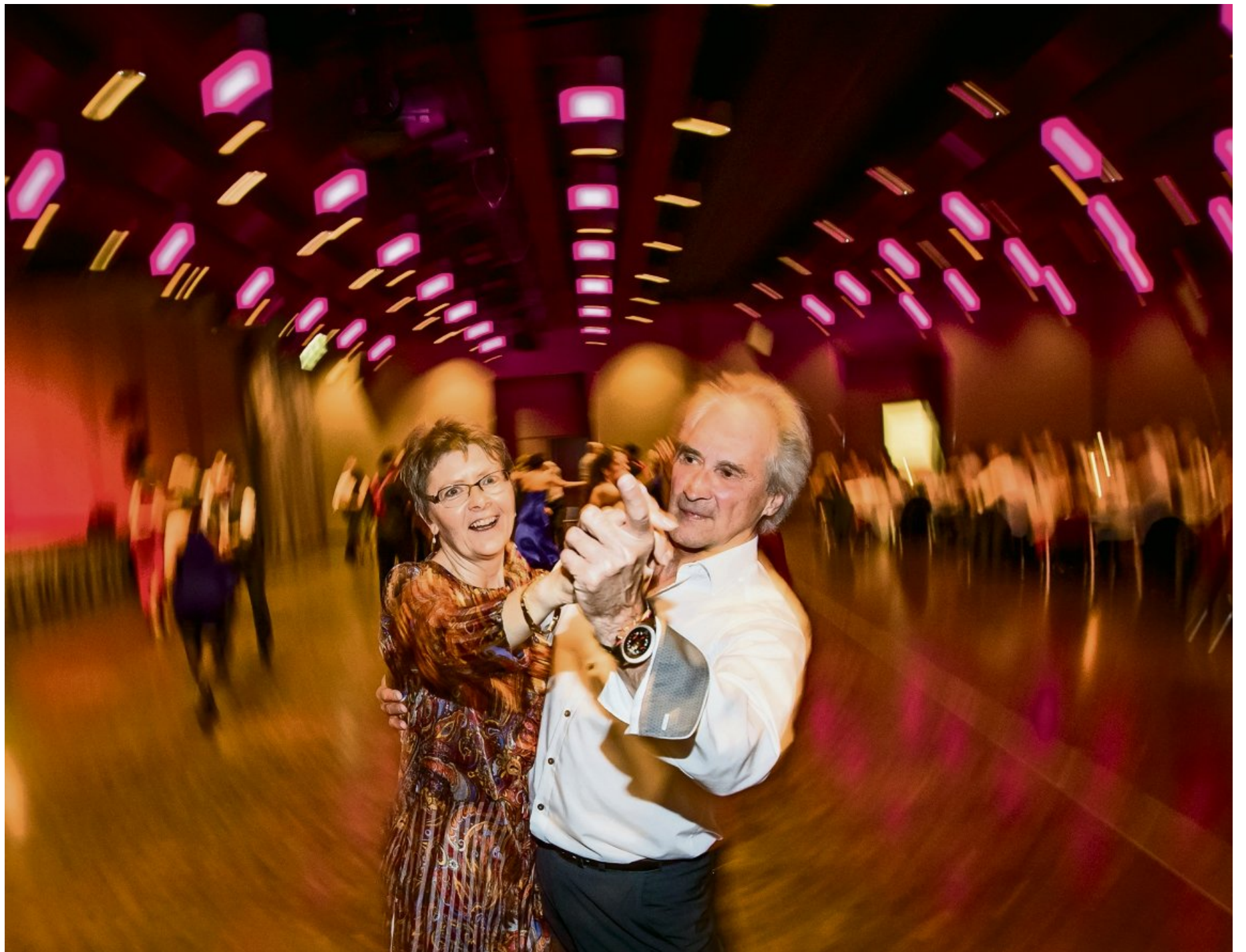
100 Tanzbegeisterte fanden sich im Hotel Mövenpick in Regensdorf ein und bewegten sich zu Tango, Cha-Cha-Cha oder Walzer.

Charmant waren auch die vier Taxi-Dancers und das Taxi-Girl, ermöglichten sie es doch, dass auch die zahlreich erschienenen